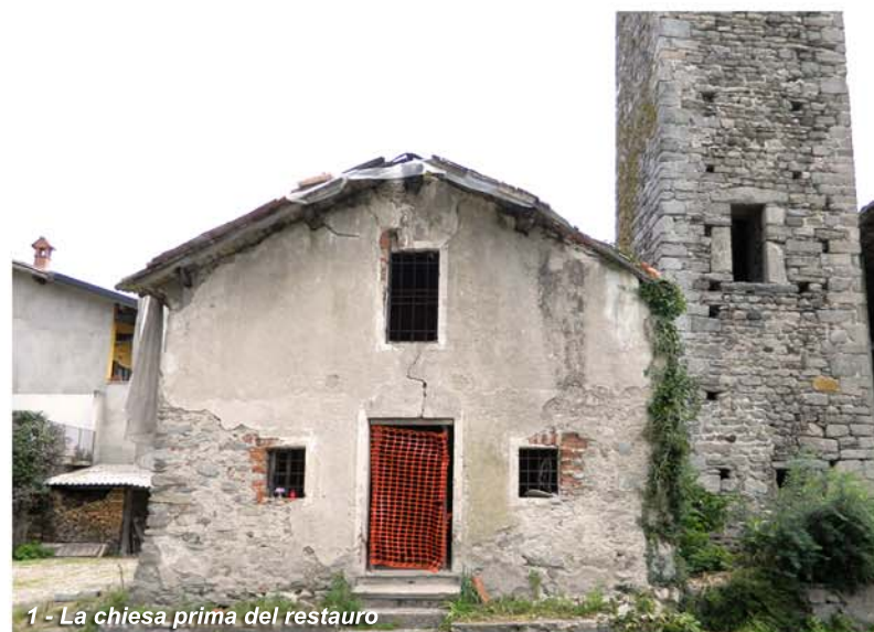
1 - La chiesa prima del restauro