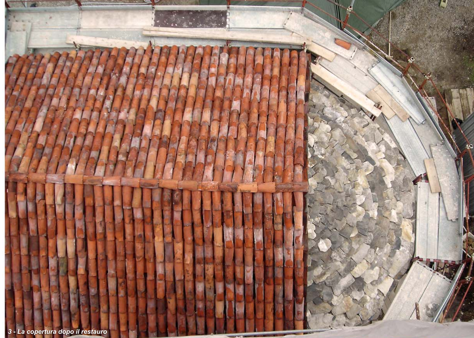
3 - La copertura dopo il restauro