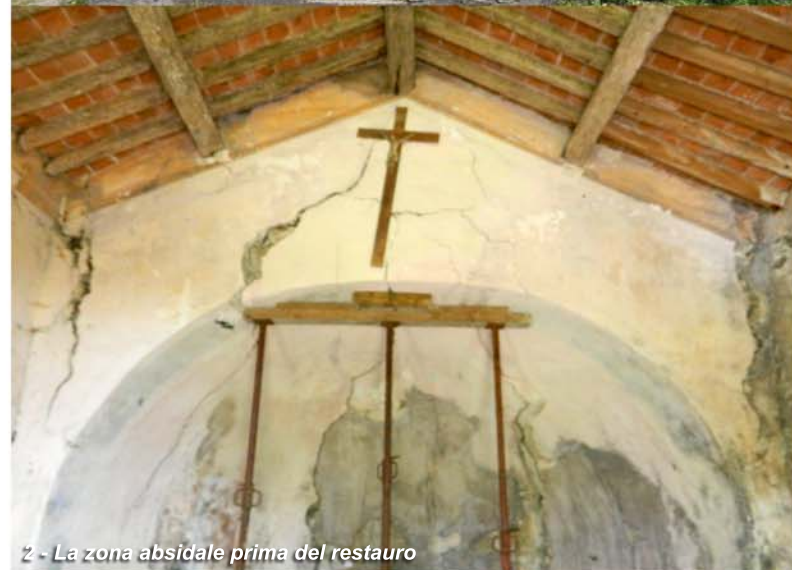
2 - La zona absidale prima del restauro