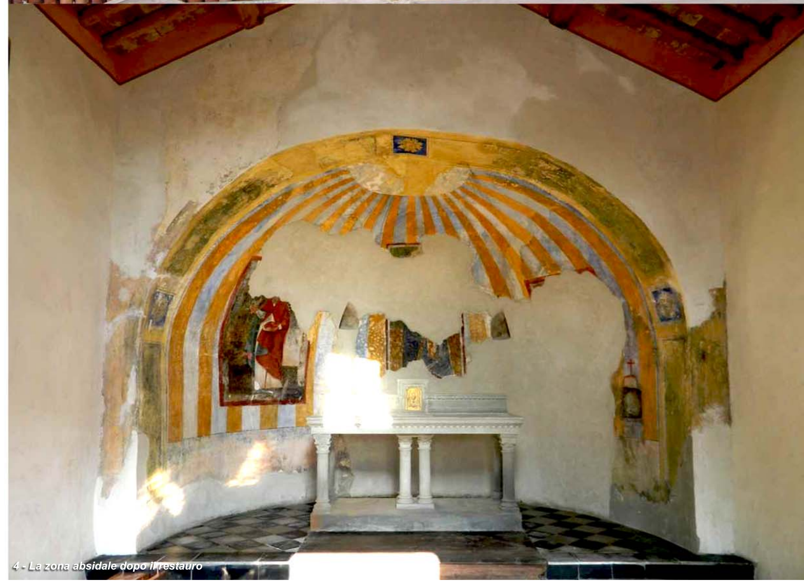
4 - La zona absidale dopo il restauro