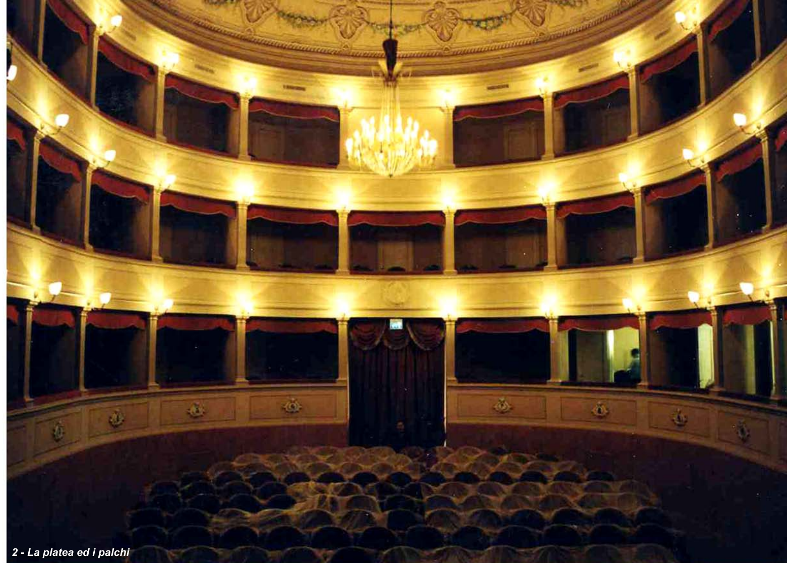
2 - La platea ed i palchi