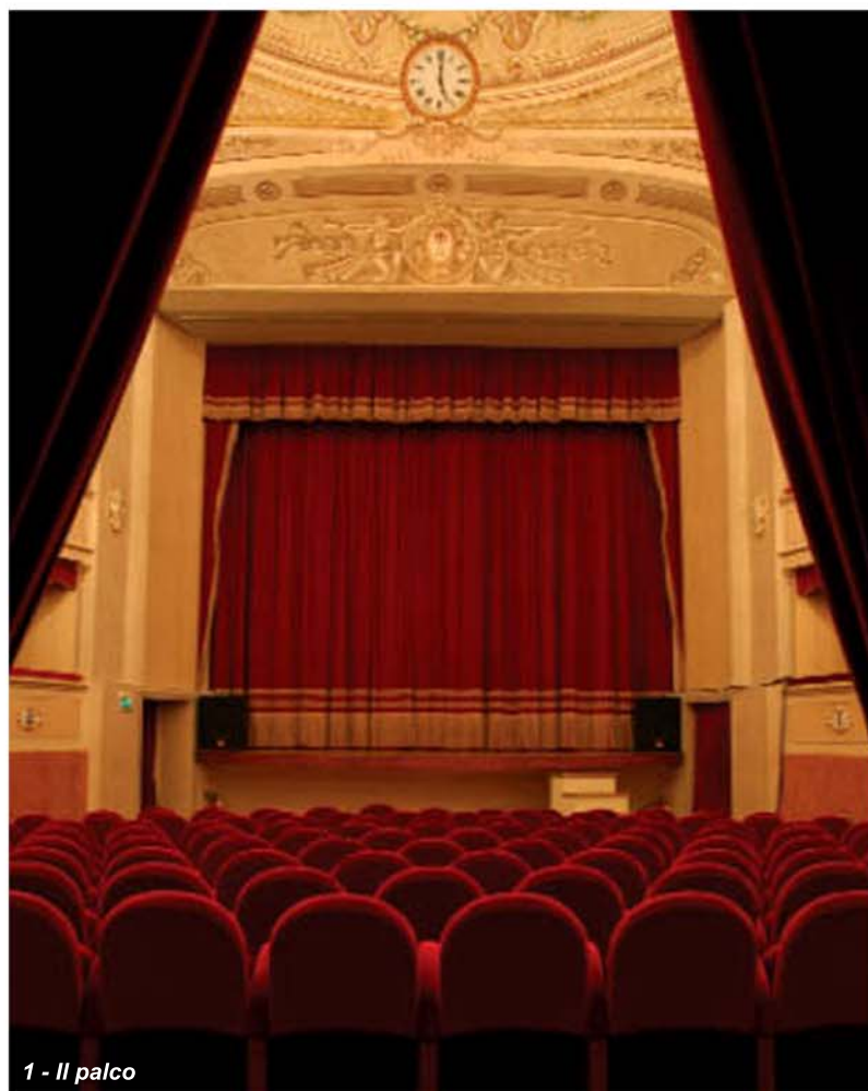
1 - Il palco